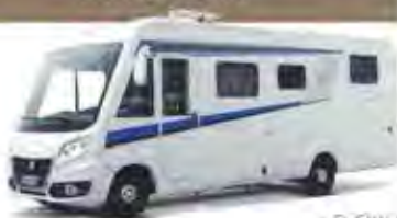
z. B. SKY