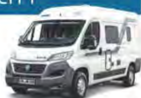
z. B. BoxLife 540

👤👤 In der KATEGORIE CITY finden Sie die kompakten Kastenwagen. Sie sind der ideale Begleiter für zwei Personen, die die Vorzüge eines wendigen und alltags-tauglichen Urlaubsgefährts zu schätzen wissen. Trotz seiner vergleichsweise geringeren Außenmaße fehlt es ihm bei seinen inneren Werten in Bezug auf Wohnkomfort und Funktionalität an nichts. Die Kastenwagen haben alle Wohnmobil-typischen Ausstattungen wie Küche, Kühlschrank, Bad und natürlich komfortable Betten.