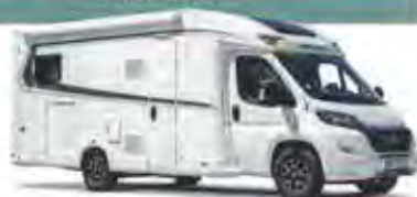
z. B. CaraSuite