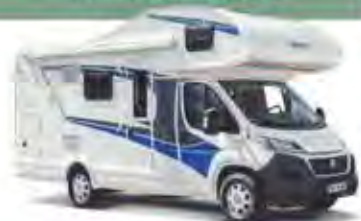
z. B. LIVE TRAVELLER