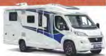
z. B. LIVE TI

👤👤(👤) Die Wohnmobile der KATEGORIE ACTIVE PLUS gehören zu den beliebtesten teilintegrierten Fahrzeugen für 2 bis 3 Personen. Viel Platz und ein hoher Reisekomfort machen sie zu Allroundern für jeden Reisetyp. Zwei feste Betten sind Standard und mit wenigen Handgriffen lässt sich aus der Sitzgruppe sogar ein drittes Bett bauen.