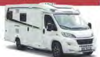
z. B. CaraCompact

👤👤 Bei der KATEGORIE ACTIVE handelt es sich um schmale teilintegrierte 2-Personen-Fahrzeuge. Trotz ihrer schlanken Außenmaße bieten sie einen hohen Wohnkomfort mit festen Betten für zwei Personen. Die kompakten, voll ausgestatteten Wohnmobile verfügen zudem über viele Staumöglichkeiten.