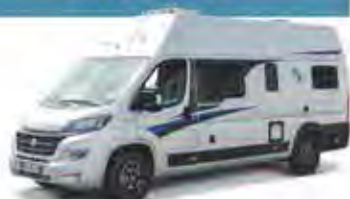
z. B. BoxStar 630 Freeway

👤👤(👤) Die Kastenwagenmodelle der KATEGORIE CITY PLUS sind ein echtes Raumwunder. Trotz ihrer kompakten Maße haben sie vier vollwertige Schlafplätze. Ermöglicht wird das durch ein Hubbett, das zur Schlafenszeit ganz einfach vom Fahrzeughimmel abgesenkt wird.